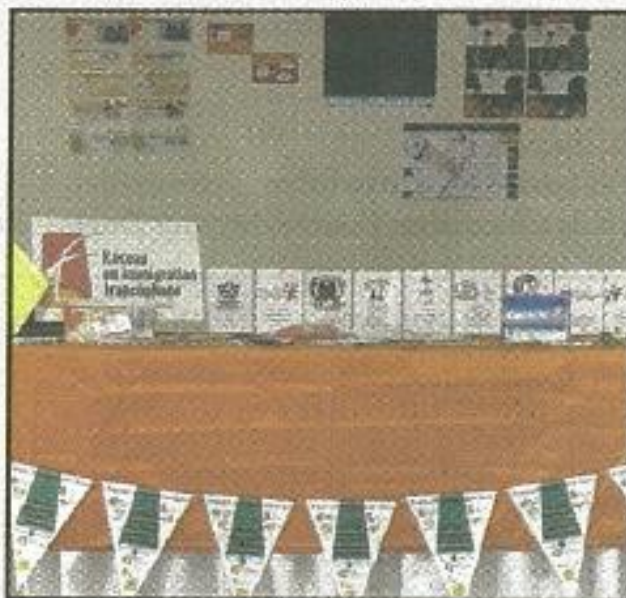
Table du RIF-SK