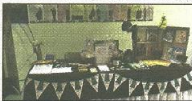
Table de la Société historique de la Saskatchewan HFOS